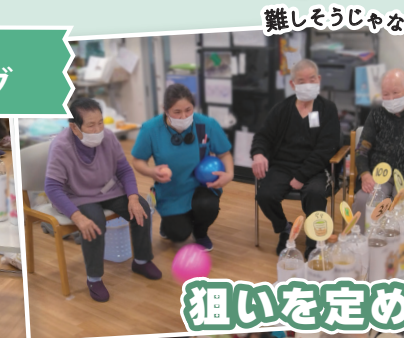
狙いを定めて的倒す 新ゲーム！