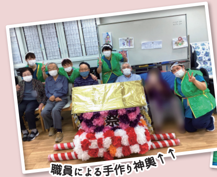
職員による手作り神輿↑↑