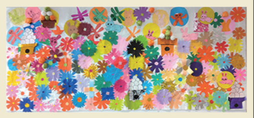
8月末に制作した 秋の壁画

皆さんこんにちは！ 長野病院通所リハビリテーションです。10月になり、日中は過ごしやすく澄んだ空気が心地良いですね。朝夕は気温が下がりやすいので、ご自宅でも体調管理には十分注意してお過ごしください。今月のデイケアは行事が盛沢山なのでお楽しみに！！今月号では、8/23(金)に行った『壁画作り』・9/11(水)に行った『宇宙旅行』の様子をお届けします。長野病院ホームページやInstagramでもイベントの様子を随時更新していますので、下記のQRコードからぜひご覧ください！