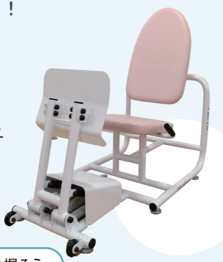
優しく持ち手を握ろう

これは膝を伸ばすトレーニングマシンで、下半身の筋力トレーニングや股関節や膝関節の可動域を広げるトレーニングが行えます。立ち上がる、座る、しゃがむ、歩く等の日常生活に必要な筋力を強化することができます。