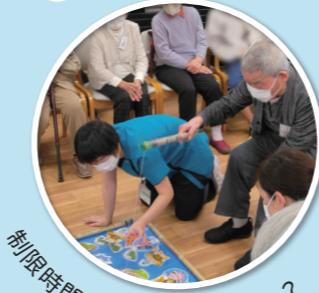
制限時間内に何点取れるかな？