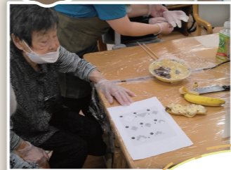
自分で作ったおやつは美味しいなあ～