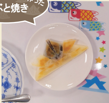
5/14のお菓子作りで作ったかぶと焼き

皆さんこんにちは！長野病院通所リハビリテーションです。 あつという間に春が過ぎて、アジサイが咲く季節になりますね。 今月号では、5月に行った『端午の節句釣り』・『お菓子作り』の様子をお届けします。長野病院ホームページやInstagramでもイベントの様子を随時更新していますので、下記のQRコードからぜひご覧ください！！ 先月から動画投稿も始めたので是非ご覧ください。