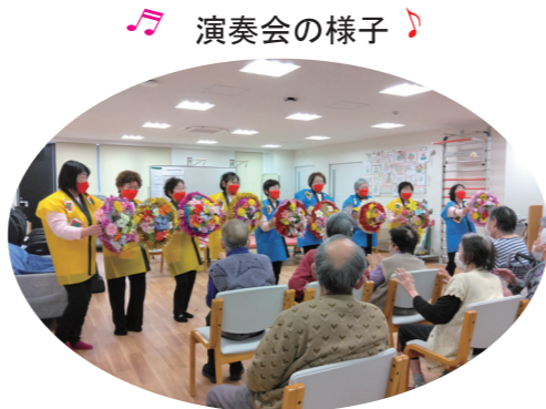
♪ 演奏会の様子 ♪

皆さまこんにちは！長野病院通所リハビリテーションです。気温の変化が激しい日々が続いておりますが、いかがお過ごしでしょうか。4月といえば春。春といえば、出会いと別れの季節ですね。人との縁を大切にしながら、新たな気持ちで今年度も歩いていきましょう！さて、新聞第8号では、3月に行った『ひな祭り』・『演奏会』の様子をお届けしたいと思います。長野病院ホームページやInstagramでもイベントの様子を更新していますので、下記のQRコードからぜひご覧ください！